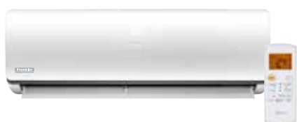
Unité intérieure murale et télécommande