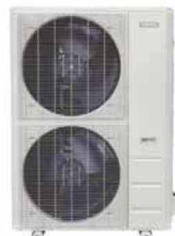
Unités extérieures simples et multibloc